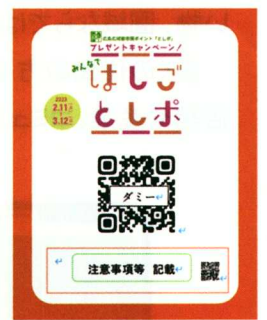
キャンペーン用 QRコードミニポスター