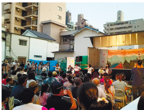
▲コミュニティまつり

旧暦6月14日・15日の「住吉祭」に合わせて開催され、日程は7月上旬から8月上旬とその年によって異なります。イベント当日は、商店街の一部が歩行者天国となり、商店街中央部に設置されたステージでは、地域の子どものダンスの発表会が行われ、大道芸人のショー、神楽などを楽しむことができます。過去には、地元出身の小学生ポップシンガーの出演も人気でした。商店街と地元住民が一体となるコミュニティの場として、昨年で28回目の開催を迎えました。「コミュニティまつり」を通じて、地域全体で活気にぎわいのある商店街づくりに取り組んでいます。