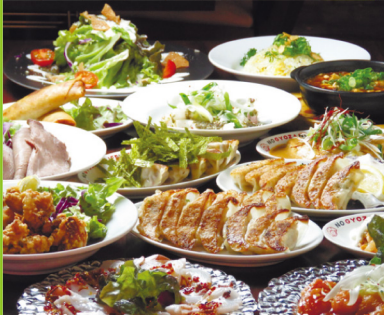
歓送迎会用コース 3,500円 (税込)

焼き餃子 290円(税込)お得な情報満載の店のアプリにも力を入れています。各種コース料理も充実しています。忘年会予約受付中!