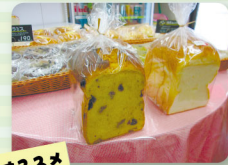
かぼちゃペーストにレーズン たっぶりの食パン(450円)

創業45年のカジカワは「日本名門酒会」の加盟店。日本中の良質な名門酒を取り扱っています。会オリジナルのラベルがついた商品もあり、贈答用などに好評だとか。焼酎の種類も豊富で人気の銘柄から家飲み用まで揃っています。