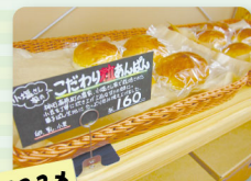
こだわりの粒あんぱん(160円)