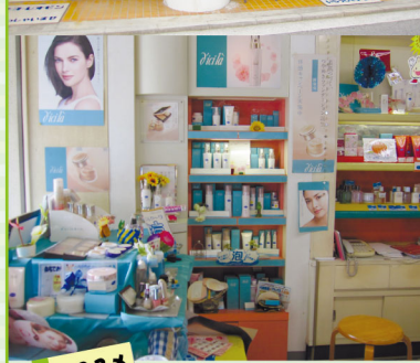
資生堂系列化粧品「ディシラ」シリーズ。湧永製薬「キョーレオピン」

西区井口 3-13-10 TEL082-278-0403 【営業時間】9:00~20:00 【定休日】日曜日