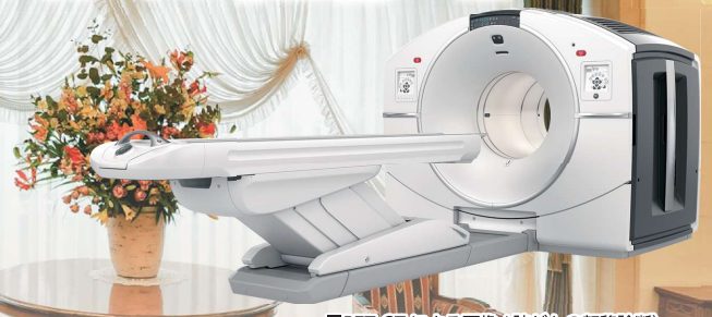
■PET-CTによる画像(肺がんの転移診断)

当クリニックでは、半導体デジタル PET-CT装置を使用して検査をします。半導体検出器は、感度2倍・解像度2倍・被ばく半分という、高精度で高品質な診断能を実現しています。PET-CT検査は、各種のがんの広がりや転移の発見ならびに治療効果の判定に活用されてきましたが、PET-CT装置では診断能の向上によりその有用性はますます高くなっています。がん健診においても短時間に全身をくまなく検査でき、小さながんの早期発見に期待されています。